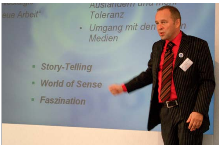
Gezielte ergebnisorientierte Moderation ist zwingend notwendig.

schiedener Moderationstechniken die Erfahrungen und Meinungen der Gruppenmitglieder erfragt und ergebnisorientiert diskutiert. Hilfreich ist hierbei vor allem die rhetorische Fähigkeit, eine ERFA-Gruppe zu großem Engagement zu bewegen und den einzelnen Mitgliedern somit einen hohen Nutzen zu geben.