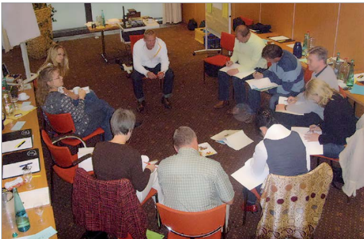
ERFA-Gruppen-Teilnehmer bei der vertrauensvollen moderierten Arbeit.

Es ist uns bekannt, dass die Qualität der Arbeitsstunden vor allem dann effizient ist, wenn sich der Leiter als Moderator versteht, der nicht permanent seine Lieblingsideen thematisiert, sondern mithilfe ver-