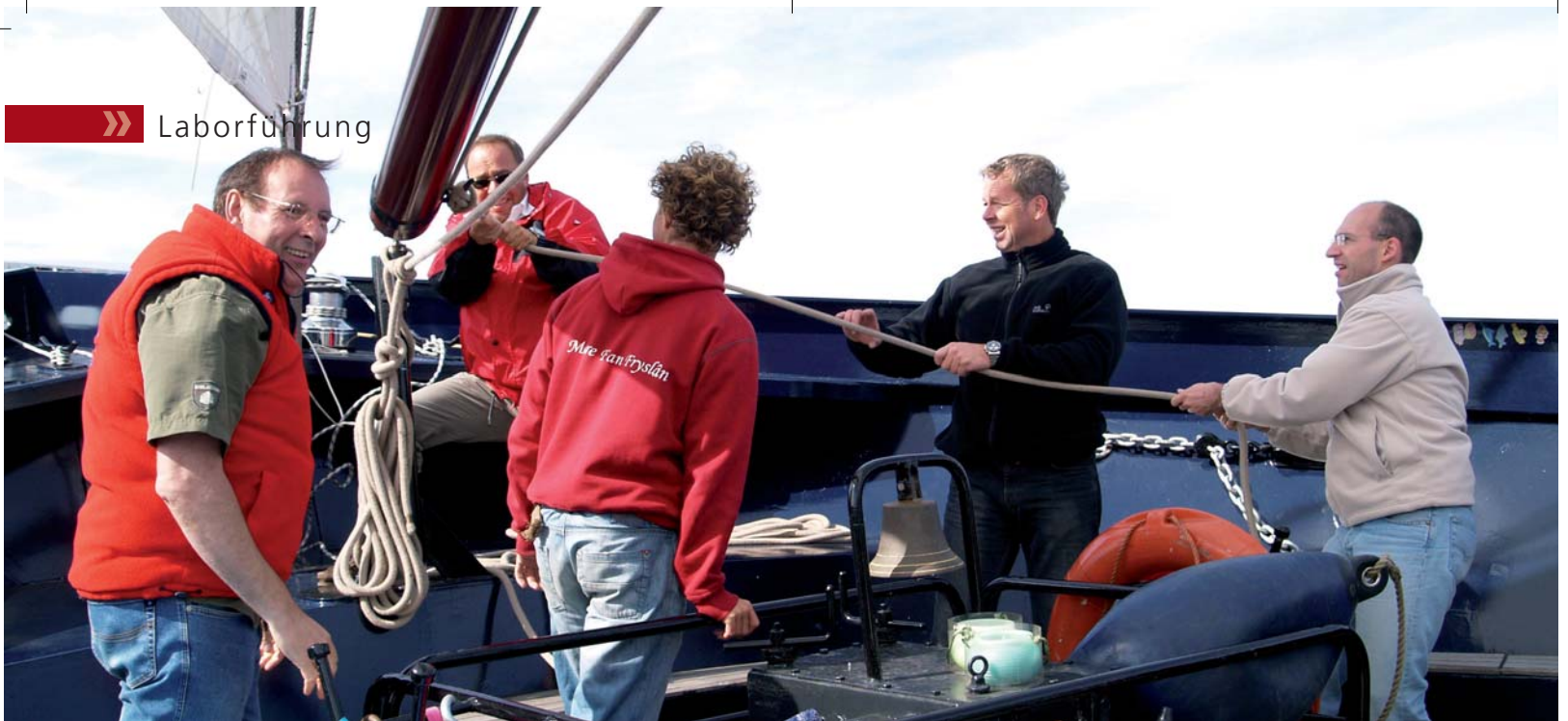
Der Veranstaltungsort einer ERFA-Gruppe kann auch „etwas Besonderes“ sein, ein neutraler Ort, zum Beispiel ein Segelschiff.